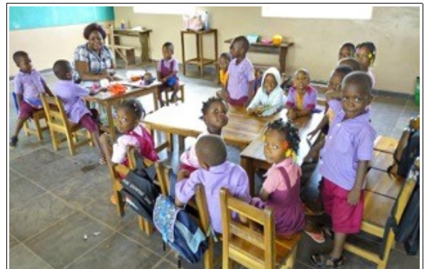
Educación infantil (32 alumnos).

ESCUELA "LES LEADERS" con un total de 290 alumnos.