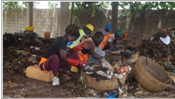
Basureros y reciclaje.