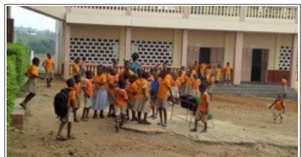
Educación primaria (174 alumnos).